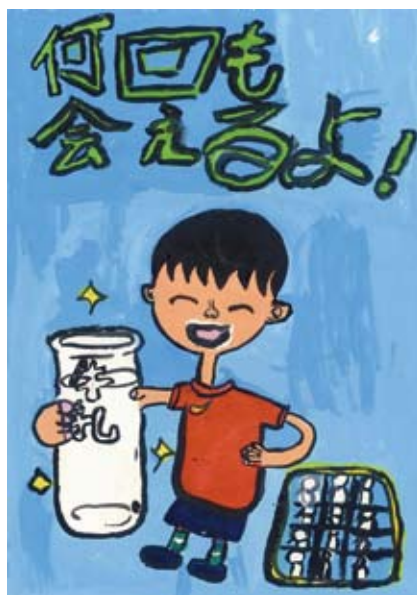
▲ 2012 度のガラスびんリサイクル促進協議会絵画・ポスターコンクールの小学校部門最優秀作品

びん牛乳の使用率が非常に高い地域もあり、びん使用率が高い(8割を超える)のは、長野県、福井県、大阪府、岡山県、山口県、香川県となっています。びんの使用率が高い地域では、紙パック牛乳と比較して安価で納入できること、びんで飲むとおいしいという意見などがあげられます。